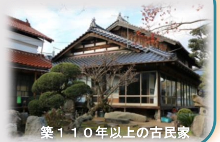
築110年以上の古民家

広島市では、「広島市地域コミュニティ活性化ビジョン」(令和4年2月策定)に基づき、市民主体のまちづくりを推進する新たな協力体制を広島型地域運営組織「ひろしまLMO(エルモ)」として認定しています。亀山学区では令和5年11月26日に「かめやままちづくり協議会」を立上げ、令和5年11月28日に広島市から「ひろしま LMO」として認定を受けました。